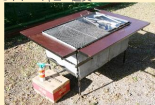
● バーベキュー道具