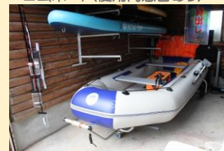
● ゴムボート(使用同意書あり)