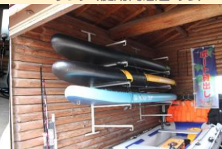
● SUPサップ(使用同意書あり)