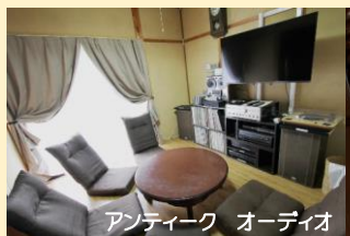
アンティーク オーディオ