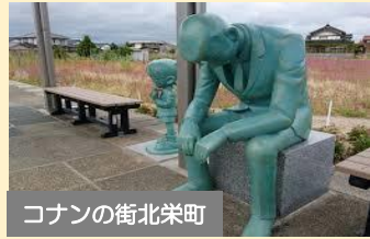
コナンの街北栄町