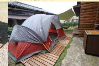
● キャンプ用テント