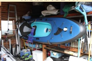
● SUP釣用(使用同意書あり)