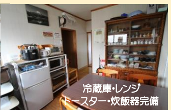
冷蔵庫・レンジ トースター・炊飯器完備