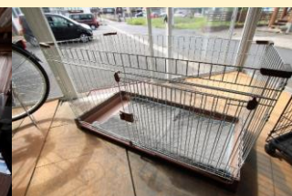
● わんちゃん用ゲージ