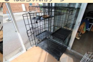
● ねこちゃん用ゲージ