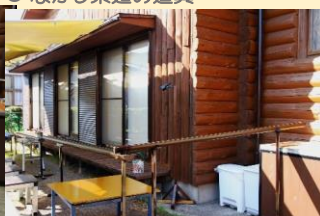
● ながし素麺の道具