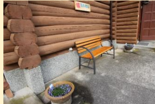
ウェルカムベンチ