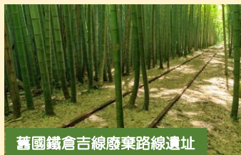
舊國鐵倉吉線廢棄線遺址