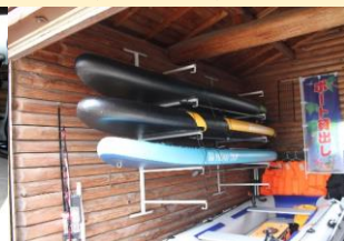
● SUP (含使用協定)