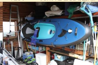
● 用於 SUP 釣魚 (包含使用協定)