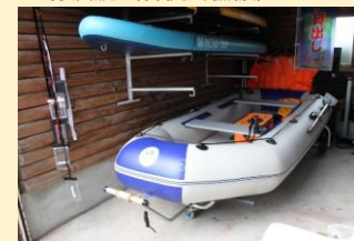
● 橡皮艇 (含使用協議)