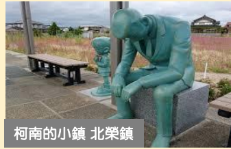
柯南的小鎮 北榮鎮